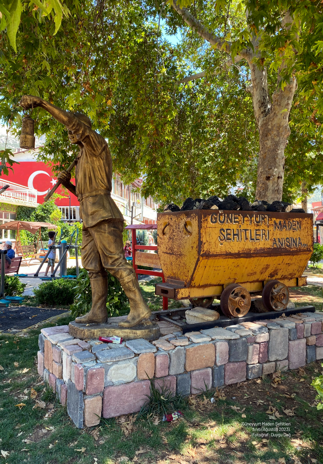
Güneyyurt Maden Şehitleri Anıtı (Ağustos 2023).