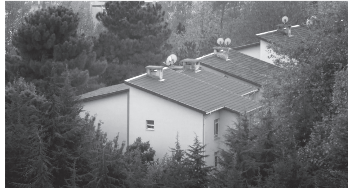
Şekil 4. Bağlık lojmanları.

Günümüzde konut üretiminde değişen ekonomi-politik iklim ve kentsel politikalar dahilinde önce içinde yaşayanlara, sonra da genel satışa açılacağı duyurulan lojmanlar, yatırımcılar için çoğunlukla tek parça arsalar olarak değer bulmuşlardır. Büyük parsellerin metropol kentlerde kapışıldığı günümüzde, yeşil alan ve konut yoğunluğunun dengeli dağıldığı lojman alanlarının yatırımcıların iştahını kabarttığını söyleyebiliriz. Günümüzde lojmanlar, rant temelli mülkiyet mekanizmaları tarafından güncel söylem diliyle "ihya edilecek" alanlar olarak, birer birer sermayenin eline bırakılacağı benziyor. ■