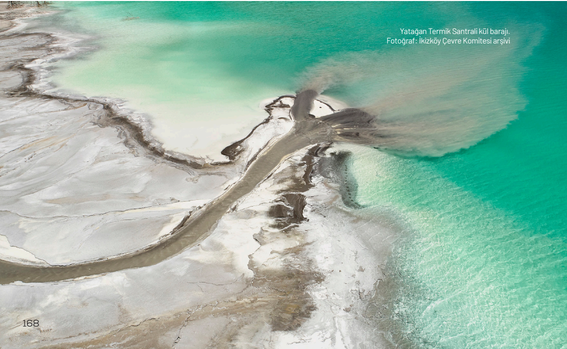
Yatağan Termik Santrali kül barajı.