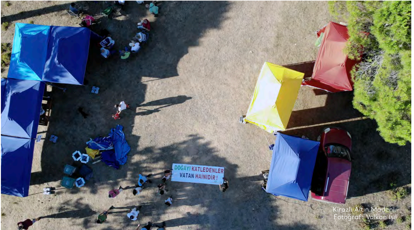
Kirazlı Altın Madeni.

2019 yılı Temmuz ayında başlayan Su ve Vicdan Nöbeti'ni Her Yer Kazdağları adıyla devam ettiren hak savunucuları ve çevreciler, 2020 yılı Eylül ayına kadar devam ettirdikleri nöbet sırasında idari makamlar ile jandarma ve polis baskılarıyla karşı karşıya kaldı. Çanakkale Orman İl Müdürlüğü ve Çanakkale Valiliği nöbet alanındaki hak savunucuları ve desteğe gelen vatandaşlara "gece ormanda konaklama" gerekçesiyle kişi başı günlük 150 TL tutarında idari para cezası kesti. 371 COVID-19 pandemisi önlemlerinin uygulamaya başladığı dönemde nöbete katılanlar, pandemi tedbirlerine uygun şekilde nöbet alanında bulunmalarına rağmen, bu kişilere Orman Bölge Müdürlüğü tarafından İl Umumi