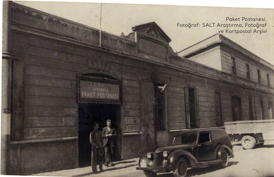
Paket Postanesi.

Bu iki kültür varlığının proje inşaatı sırasında yıkılması ve projenin yer aldığı Karaköy Kemankeş Caddesi'nde oluşan çatlaklar sebebiyle Mimarlar Odası İstanbul Büyükkent Şubesi yetkililer hakkında suç duyurusunda bulundu. 195 Suç duyurusunun ardından İstanbul 2 No'lu Koruma Kurulu, proje