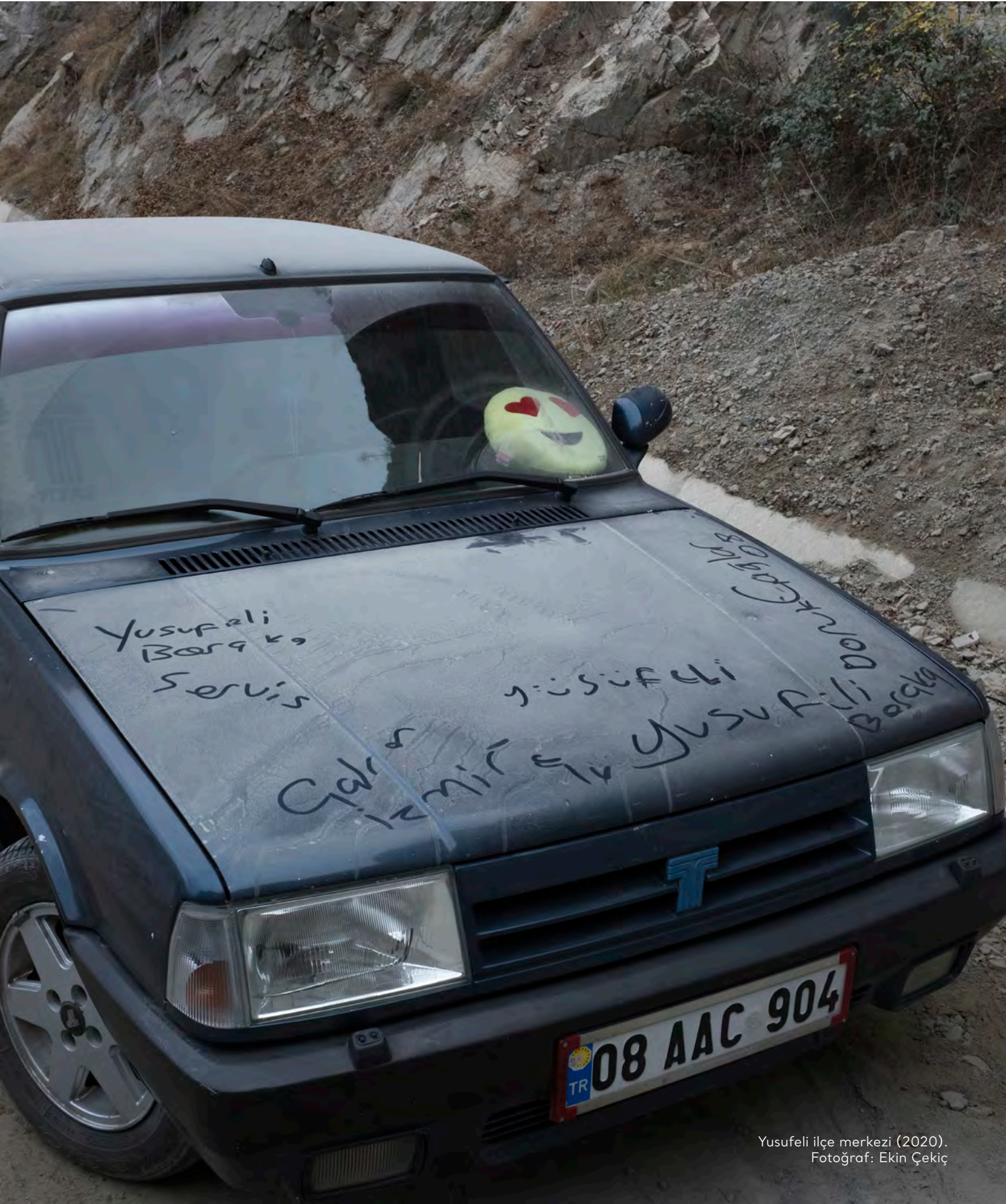
Yusufeli ilçe merkezi (2020).