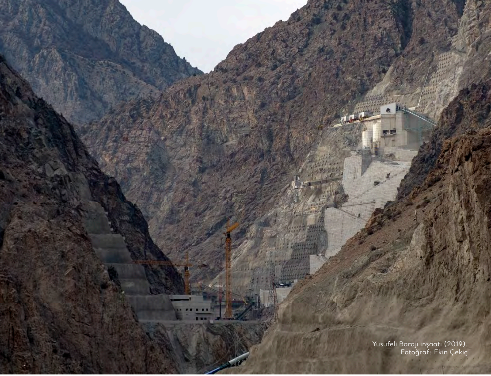
Yusufeli Barajı inşaatı (2019).