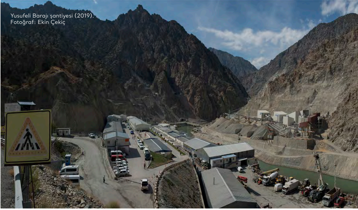
Yusufeli Barajı şantiyesi (2019).

tışına karşı işçiler şantiyenin kapatılıp herkesin evine gönderilmesi önerisinde bulundu; ancak bu önerileri dikkate alınmadı. Şantiye dışına çıkmaları yasaklanan işçiler, pandemi dönemindeki bu çalışma koşullarına karşı iş bırakma eylemi gerçekleştirdiler. 449