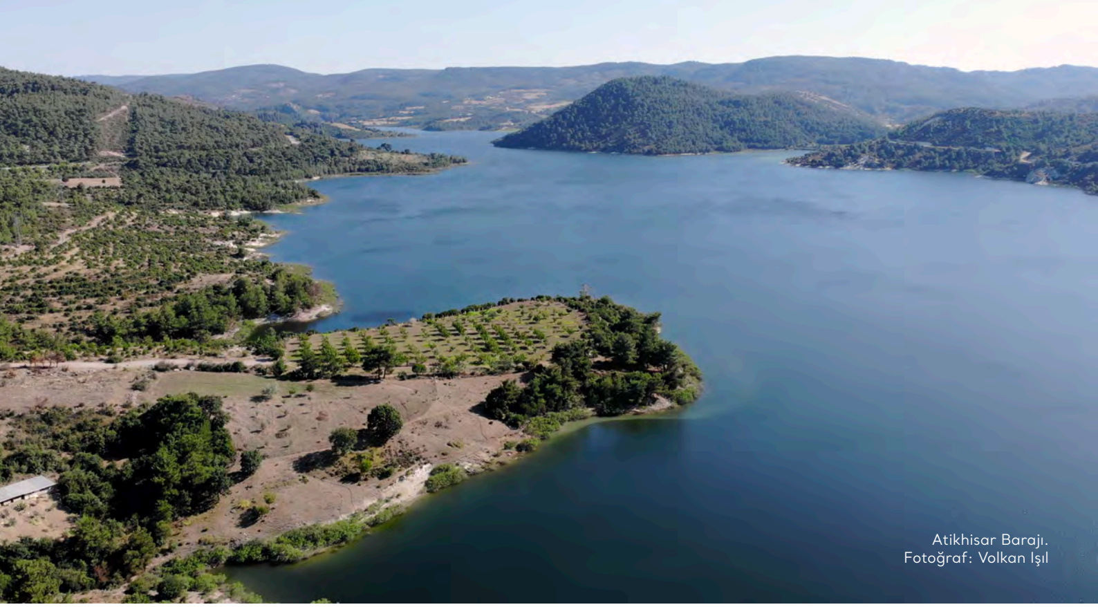
Atikhisar Barajı.

manların yerini tutmayacağına vurgu yapıyor: "Biyolojik çeşitlilik, toprak/su dengesini sağlama, toprakta besleyici maddelerin bulunma miktarları, su havzalarının korunması gibi konularda doğal ormanlar, ağaçlandırmalardan fersah fersah üstündür. (...) Kesilen orman alanları hakkında "biz kesilen ağaçlar karşılığında birkaç katı fidan dikiyoruz" denmesi büyük bir bilgisizlik ürünüdür. Bir orman ekosistemi, sayısız canlının yüzlerce yılda dayanışma ve rekabet içinde bir araya gelerek oluşturduğu bir bütündür, sayısı ve şiddeti bilinemeyecek kadar çok etkileşim içindeki binlerce alt sistemden oluşur. Orman alanını yok ettiğinizde bir sistem içindeki onlarca bitki ve hayvan türünü uzaklaştırırken, dikim yaptığınızda en fazla bir-iki bitki türünü alana getirmiş olursunuz." 354