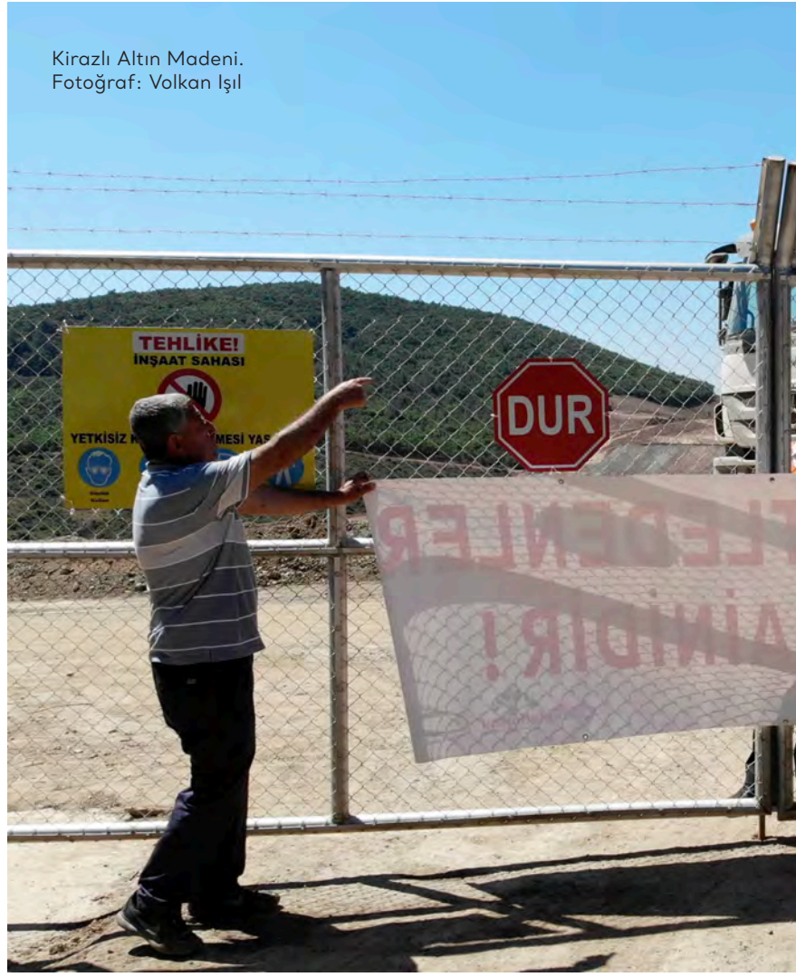
Kirazlı Altın Madeni.

Çalışmamız kapsamında Doğu Biga Madencilik'in kurumsal web sayfası ve sosyal medya hesaplarındaki paylaşımlarından hareketle yaptığımız taramada Doğu Biga Madencilik'in kamuyla paylaştığı herhangi bir insan hakları politikasına rastlamadık. İnternet Arşivi'nin veritabanında yer alan kurumsal web sitesi kaydında