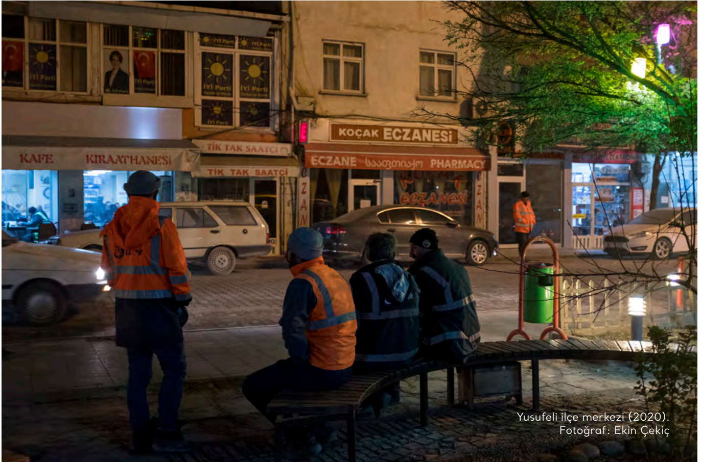
Yusufeli İlçe merkezi (2020).

makinaları almış başını gidiyor şehrin göbeğinden. İnsanlar, koca koca çocukları dahi, anneler babalar ellerinden tutup okula götürüyor. Allah korusun çocuğum bir makinenin, iş makinesinin altında kalacak endişesiyle. Sadece trafik sorunu değil, ciddi anlamda çevre problemimiz, sağlık problemimiz, hava problemimiz var. Arabayı yıkatıyorsun, yarım saate, bir saate arabayı toz kaplıyor. Evini siliyorsun, yine yarım saate, bir saate evde yine aynı toz oluyor. Balkonlarda insanlar oturamıyorlar. Aldığımız nefes zehir. Evet, kısa vadede biz bunu algılayamıyor olabiliriz. Ama uzun vadede insanların, Yusufeli halkının hayatının son 10 yılını alıyorlar elimizden. Bitkilerde bunu çok ciddi anlamda görüyoruz. %100 verim aldığımız meyvelerde, sebzelerde şu an o oran %20-30'lara kadar düştü. Sebebi hava kirliliği." 434