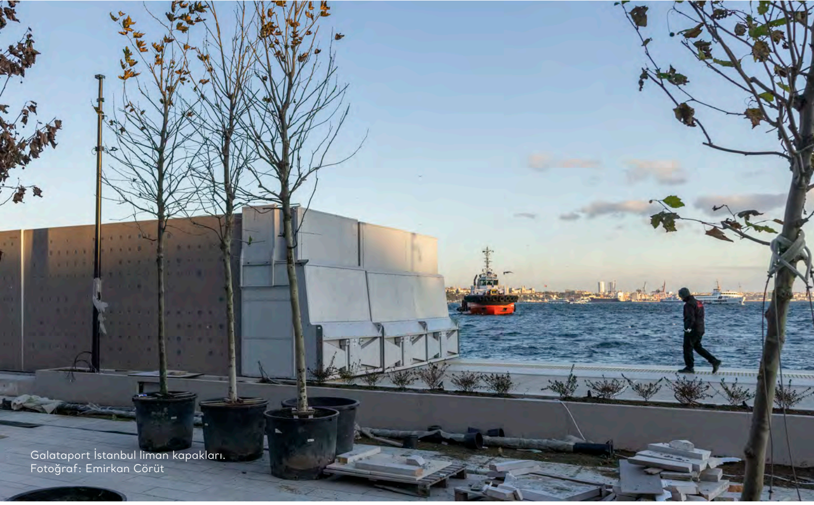
Galataport İstanbul liman kapakları.

Galataport İstanbul Liman İşletmeciliği'nin de hâkim ortağı.