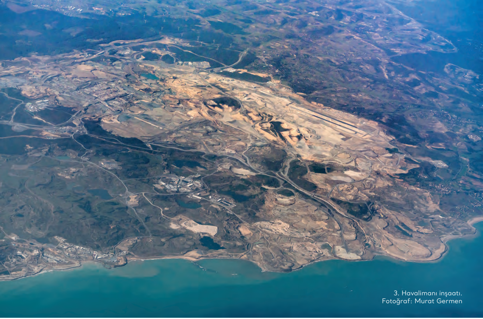
3. Havalimanı inşaatı.

cek olumsuz etkileri etkin bir şekilde azaltma beyan ve taahhüdünde bulunuyor. Şirketin bu beyan ve taahhüdü uyarınca olumsuz etkileri düzeltmek için nasıl bir süreç benimsediğine ilişkin bilgiye şirketin kurumsal web sayfasında erişemedik.