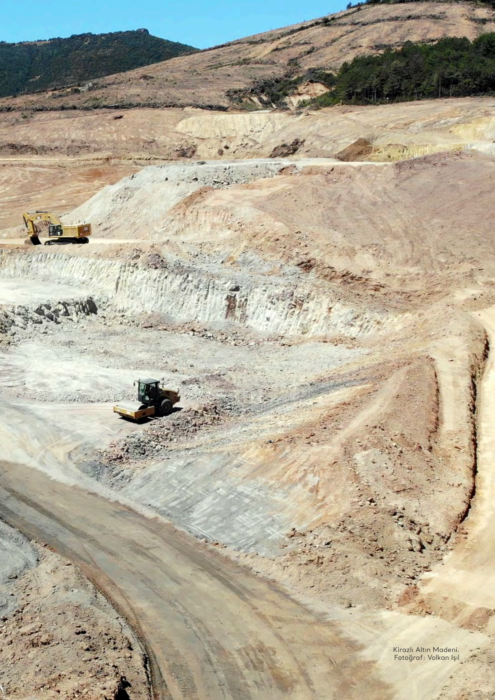
Kirazlı Altın Madeni.