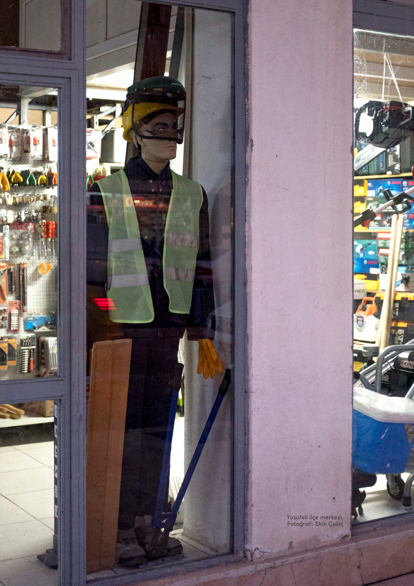
Yusufeli ilçe merkezi.