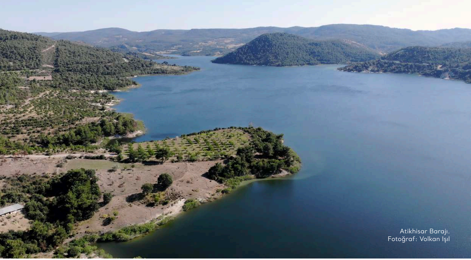
Atikhisar Barajı.

manların yerini tutmayacağına vurgu yapıyor: "Biyolojik çeşitlilik, toprak/su dengesini sağlama, toprakta besleyici maddelerin bulunma miktarları, su havzalarının korunması gibi konularda doğal ormanlar, ağaçlandırmalardan fersah fersah üstündür. (...) Kesilen orman alanları hakkında "biz kesilen ağaçlar karşılığında birkaç katı fidan dikiyoruz" denmesi büyük bir bilgisizlik ürünüdür. Bir orman ekosistemi, sayısız canlının yüzlerce yılda dayanışma ve rekabet içinde bir araya gelerek oluşturduğu bir bütündür, sayısı ve şiddeti bilinemeyecek kadar çok etkileşim içindeki binlerce alt sistemden oluşur. Orman alanını yok ettiğinizde bir sistem içindeki onlarca bitki ve hayvan türünü uzaklaştırırken, dikim yaptığınızda en fazla bir-iki bitki türünü alana getirmiş olursunuz." 354