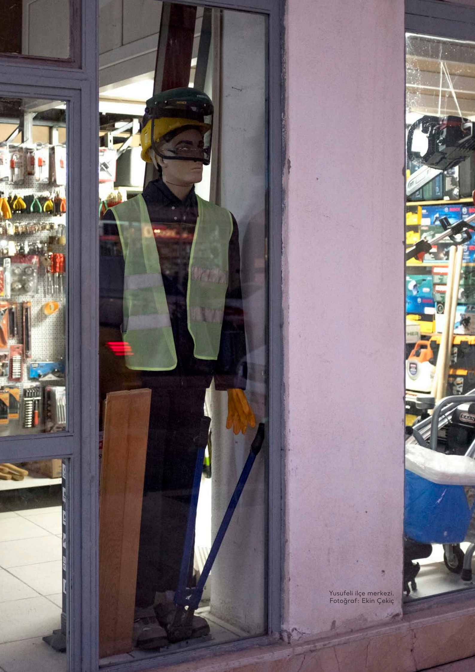
Yusufeli ilçe merkezi.