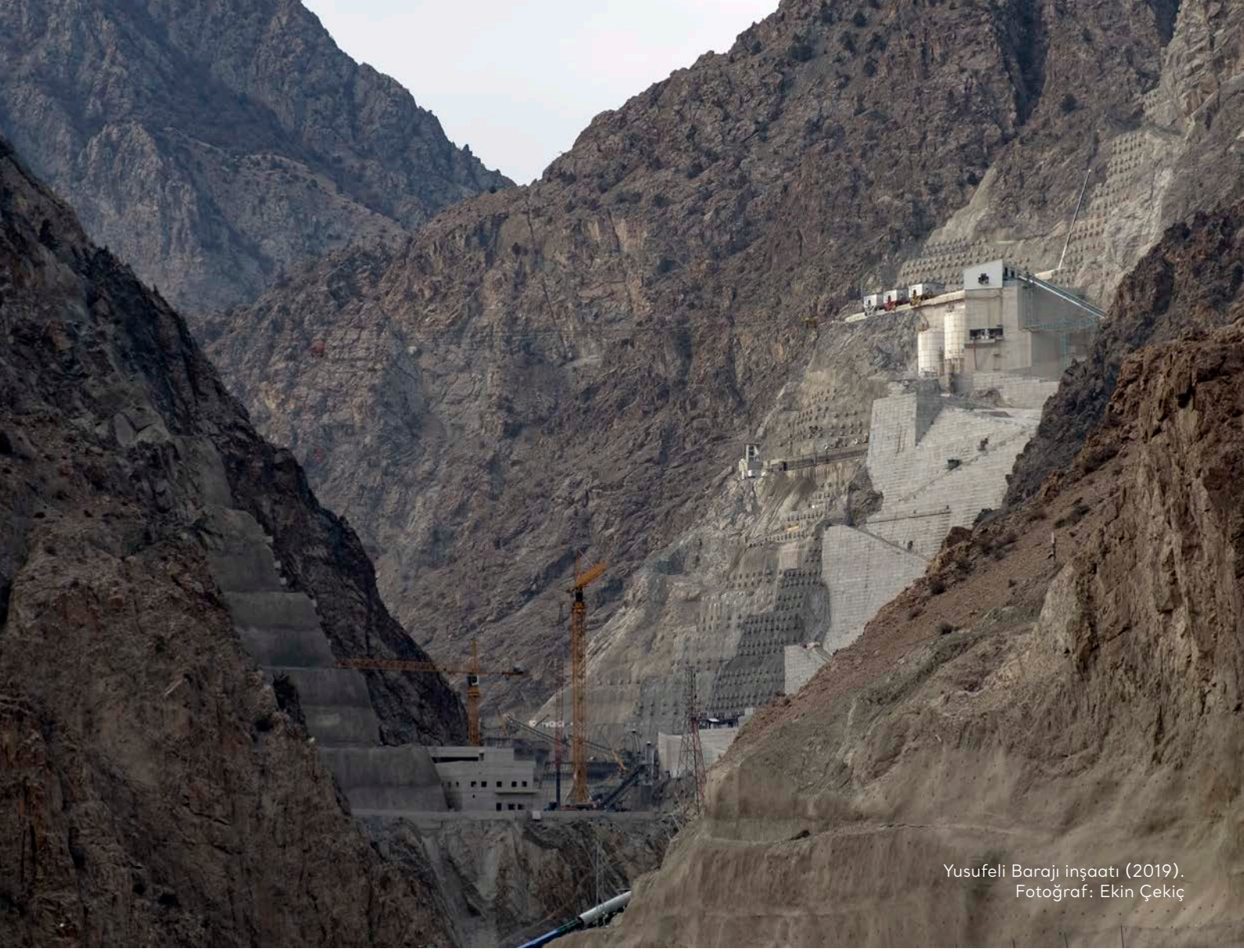
Yusufeli Barajı inşaatı (2019).