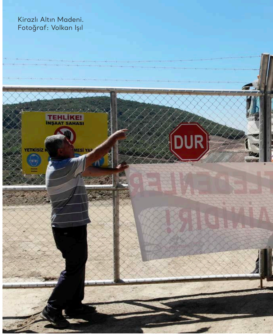
Kirazlı Altın Madeni.

"Sürdürülebilirlik" başlığında "İşimizin her alanında sürdürülebilir kalkınma ilkelerini benimsiyoruz. Bizim için sürdürülebilirlik, sağlık ve güvenlik, çevre yönetimi, toplum katılımı, güvenlik ve insan hakları alanlarında mükemmelliği kapsar." şeklinde bir açıklama yer alıyor. 388 Bu açıklamanın devamında ana şirket Alamos Gold'un yıllık ESG raporlarına yönlendirme yapılıyor.