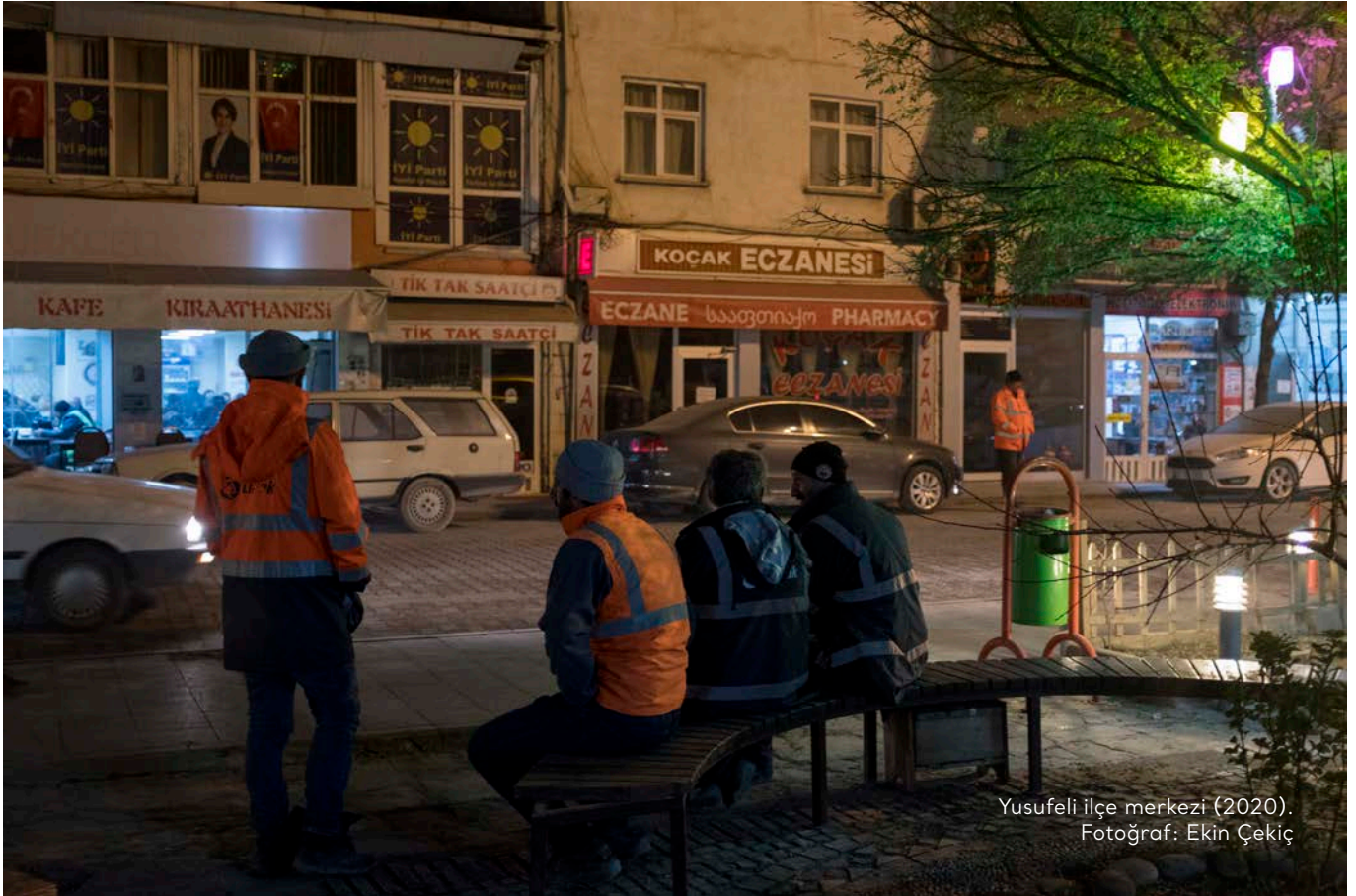
Yusufeli İlçe merkezi (2020).

makinelere almış başını gidiyor şehrin göbeğinden. İnsanlar, koca koca çocukları dahi, anneler babalar ellerinden tutup okula götürüyor. Allah korusun çocuğum bir makinenin, iş makinesinin altında kalacak endişesiyle. Sadece trafik sorunu değil, ciddi anlamda çevre problemimiz, sağlık problemimiz, hava problemimiz var. Arabayı yıkatıyorsun, yarım saate, bir saate arabayı toz kaplıyor. Evini siliyorsun, yine yarım saate, bir saate evde yine aynı toz oluyor. Balkonlarda insanlar oturamıyorlar. Aldığımız nefes zehir. Evet, kısa vadede biz bunu algılayamıyor olabiliriz. Ama uzun vadede insanların, Yusufeli halkının hayatının son 10 yılını alıyorlar elimizden. Bitkilerde bunu çok ciddi anlamda görüyoruz. %100 verim aldığımız meyvelerde, sebzelerde şu an o oran %20-30'lara kadar düştü. Sebebi hava kirliliği." 434