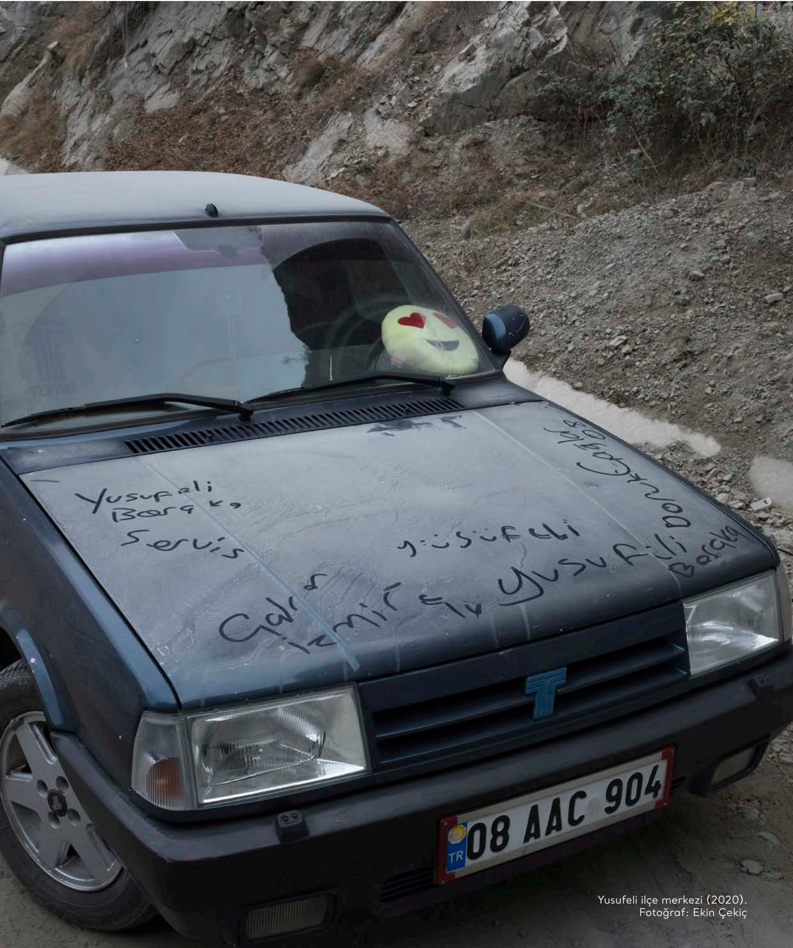
Yusufeli ilçe merkezi (2020).