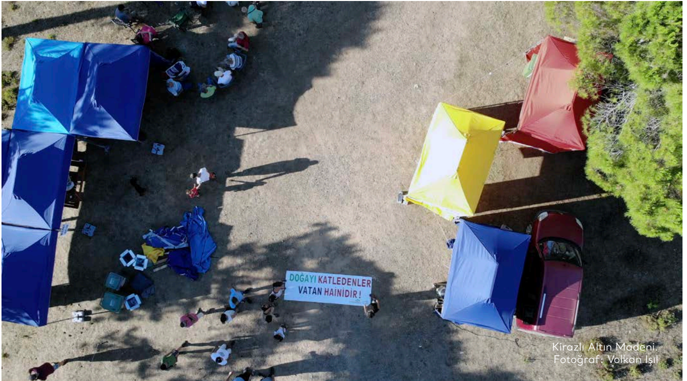
Kirazlı Altın Madeni.

2019 yılı Temmuz ayında başlayan Su ve Vicdan Nöbeti'ni Her Yer Kazdağları adıyla devam ettiren hak savunucuları ve çevreciler, 2020 yılı Eylül ayına kadar devam ettirdikleri nöbet sırasında idari makamlar ile jandarma ve polis baskılarıyla karşı karşıya kaldı. Çanakkale Orman İl Müdürlüğü ve Çanakkale Valiliği nöbet alanındaki hak savunucuları ve desteğe gelen vatandaşlara "gece ormanda konaklama" gerekçesiyle kişi başı günlük 150 TL tutarında idari para cezası kesti. 371 COVID-19 pandemisi önlemlerinin uygulamaya başladığı dönemde nöbete katılanlar, pandemi tedbirlerine uygun şekilde nöbet alanında bulunmalarına rağmen, bu kişilere Orman Bölge Müdürlüğü tarafından İl Umumi