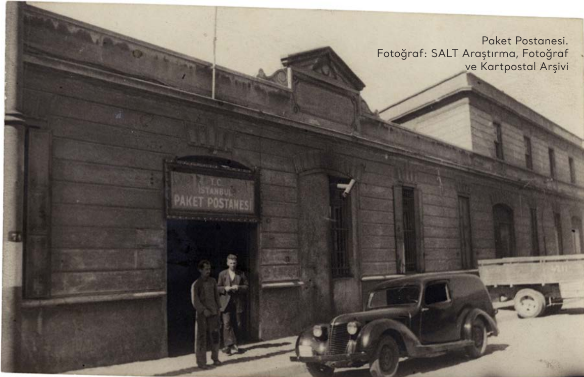
Paket Postanesi.

Bu iki kültür varlığının proje inşaatı sırasında yıkılması ve projenin yer aldığı Karaköy Kemankeş Caddesi'nde oluşan çatlaklar sebebiyle Mimarlar Odası İstanbul Büyükkent Şubesi yetkililer hakkında suç duyurusunda bulundu. 195 Suç duyurusunun ardından İstanbul 2 No'lu Koruma Kurulu, proje