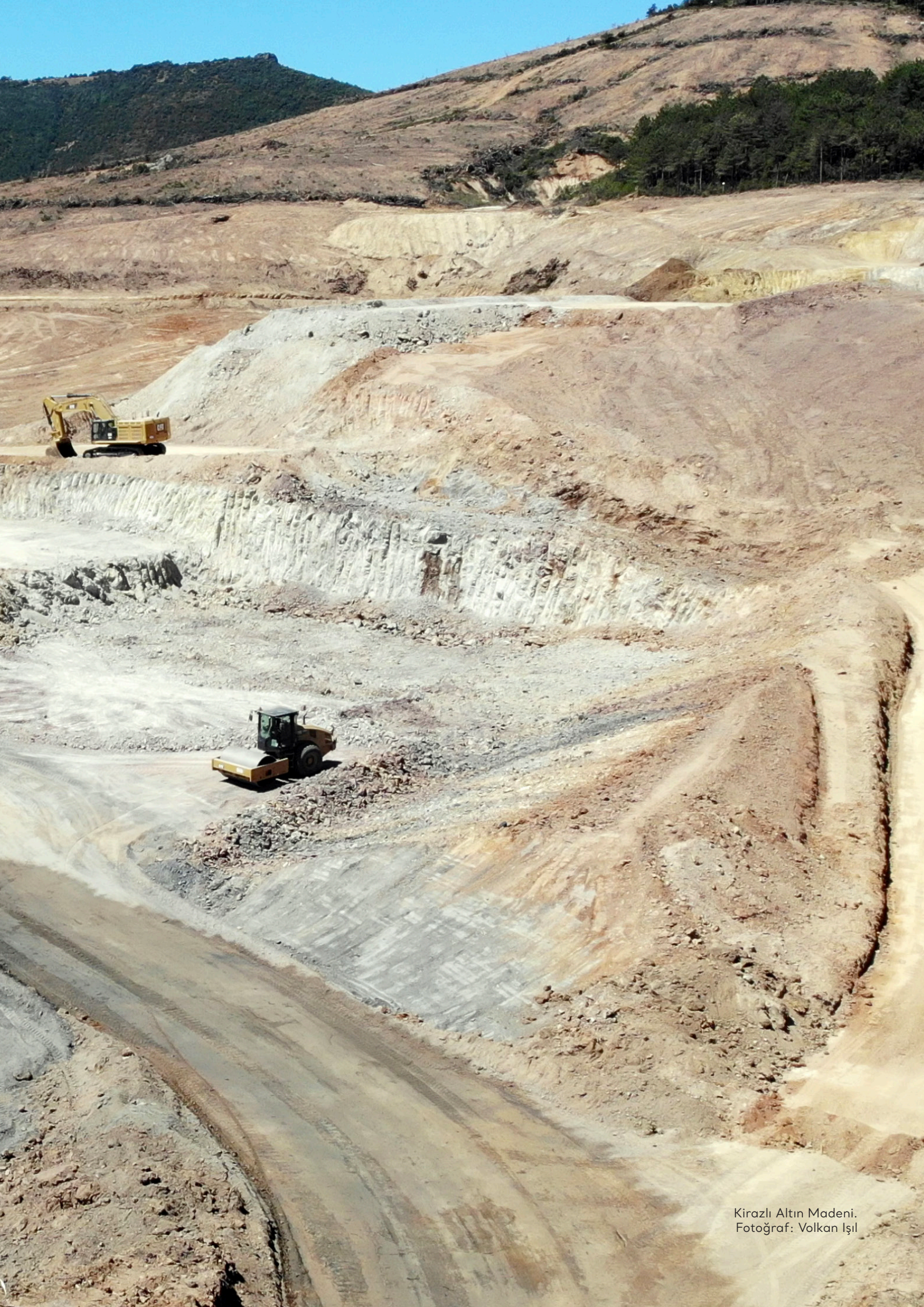
Kirazlı Altın Madeni.