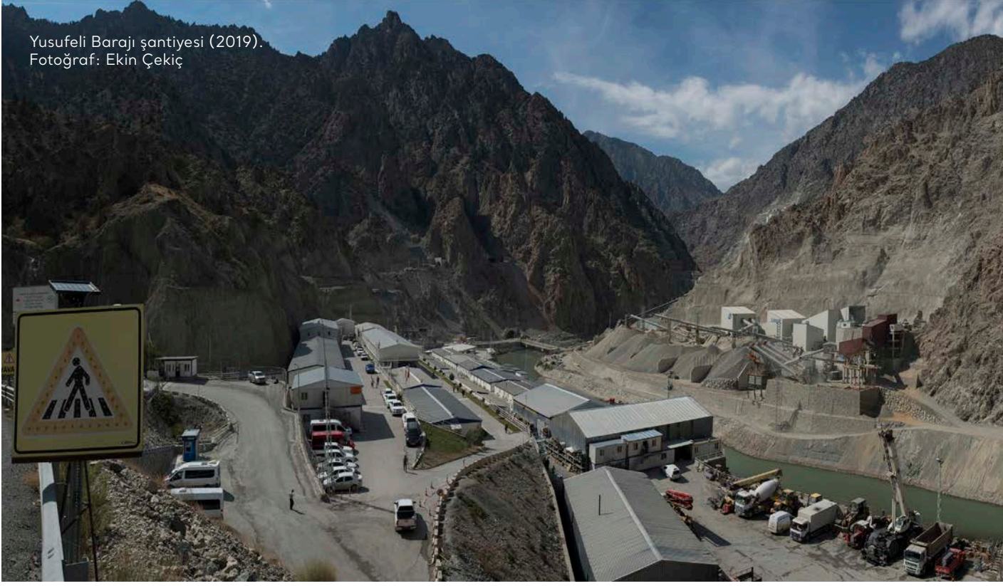
Yusufeli Barajı şantiyesi (2019).

tışına karşı işçiler şantiyenin kapatılıp herkesin evine gönderilmesi önerisinde bulundu; ancak bu önerileri dikkate alınmadı. Şantiye dışına çıkmaları yasaklanan işçiler, pandemi dönemindeki bu çalışma koşullarına karşı iş bırakma eylemi gerçekleştirdiler. 449